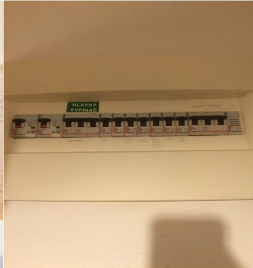
Obrázok 2 - Rozvody