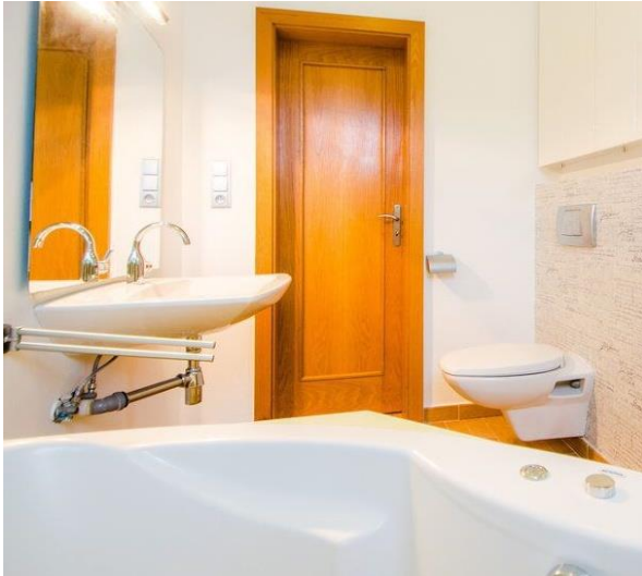
Obrázok 1 – Kúpeľňa s WC