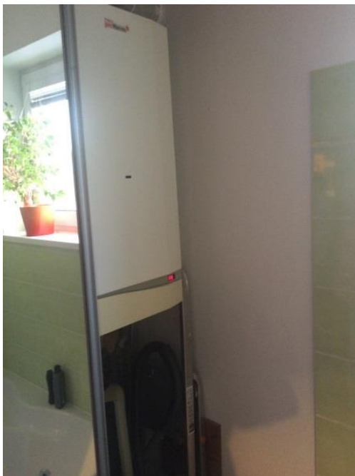
Obrázok 3 – Plynový kotol